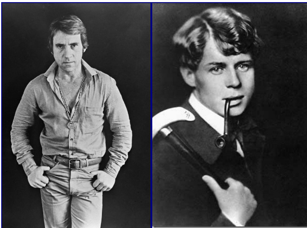
Владимир Высоцкий и Сергей Есенин

"Альфа-самцы" щедры, дерзки, необузданны и способны найти выход из любой ситуации. Их мысли направлены в будущее. "Альфа-самцы" не жалеют себя и требуют того же от своей команды, потому в обществе часто слыт диктаторами. Такие мужчины не имеют никаких стремлений к благосостоянию, накоплению имущества и пр.