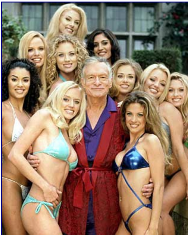
Лучший медийный образ альфа-самца - Хью Хефнер

Термин "альфа-самец" произошел из науки этологии, которая рассматривает каждого индивидуума как часть животного мира. На его вершине всегда находится такой вот самец, который уже рождён с заданными свойствами вожака стаи. Изменить эти параметры невозможно. Стать "альфа-самцом" самостоятельно тоже нельзя.